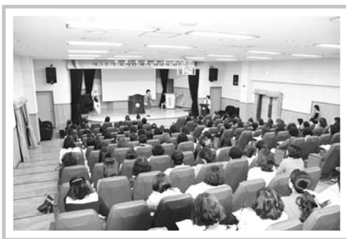
유치원 평가 담당자 연수