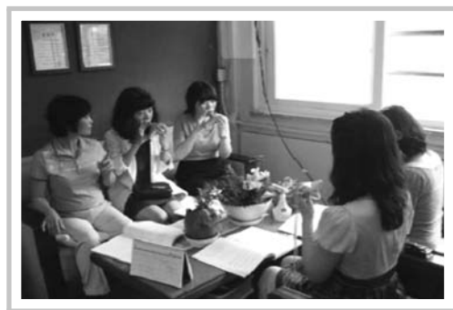
교원 연구 동아리(광주방림유치원)