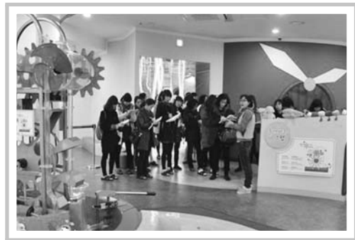
선생님 미리 체험하기