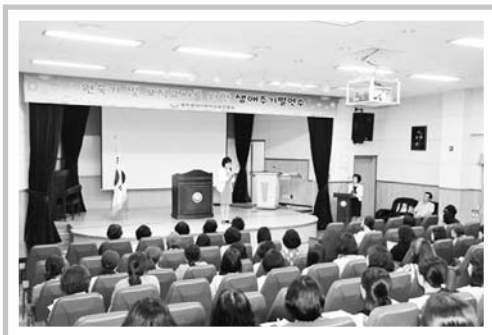
교원 능력 개발 연수