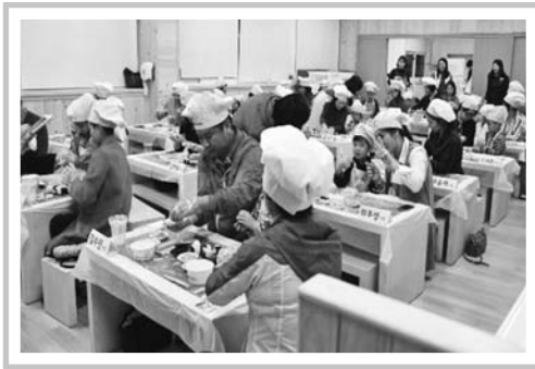
다문화 가족 문화 체험