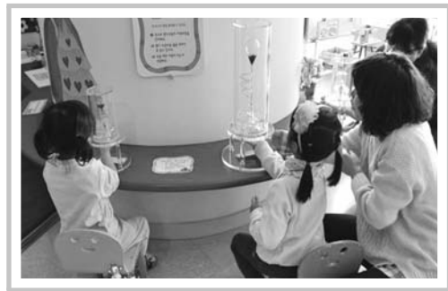
유아 체험 프로그램