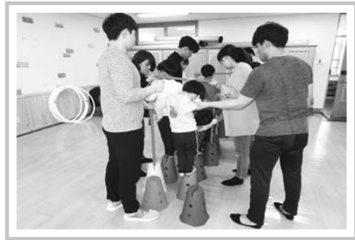
보담 놀이실 운영